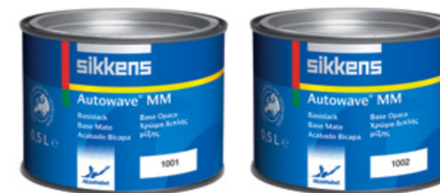
Sikkens Autowave MM en dosage facile : Easy dose 1001 et 1002

* SIKKENS, reconnu pour ses innovations et sa technologie de pointe est actuellement engagée dans un partenariat unique avec l'équipe de course automobile de Formule 1 Vodafone McLaren Mercedes. La marque fournit à la nouvelle formule 1 MP4-26 des revêtements ultralégers, à séchage rapide, très performants et aérodynamiques.