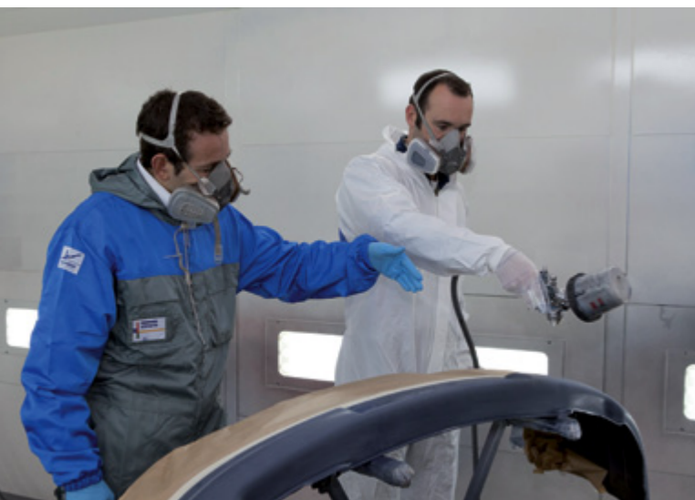
Formation par le Conseiller Technique SIKKENS